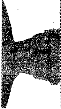
Bruno S. Frey

Mütter und Manager sind vor der Mattscheibe schneller frustriert als Pensionierte oder Arbeitslose