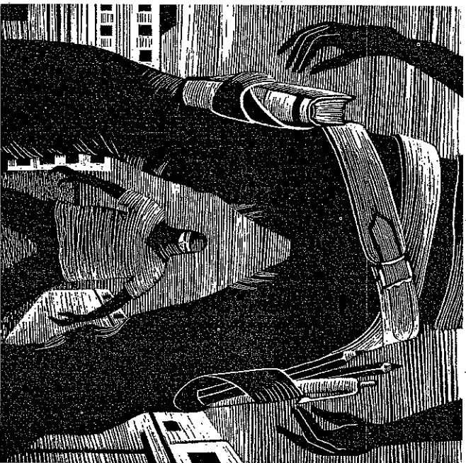
ILLUSTRATION: GABRIEL KOPP

Damit wird nach wie vor auf eine extreme Form der Abschreckungspolitik gesetzt. Alle Personen, die im leisesten Verdacht stehen, mit dem Terrorismus in Verbindung zu stehen, müssen unschuldig gemacht werden. Wenn Unbeteiligte dabei zu Schaden kommen oder gar getötet werden, wird dies als unvermeidlich hingenommen. Zudem erlaubt die Doktrin des Präventivkriegs im Prinzip, alle denkbaren Terrorismushandlungen auszuschliessen. Praktisch ist dies zwar unmöglich, denn es gibt auf der Welt