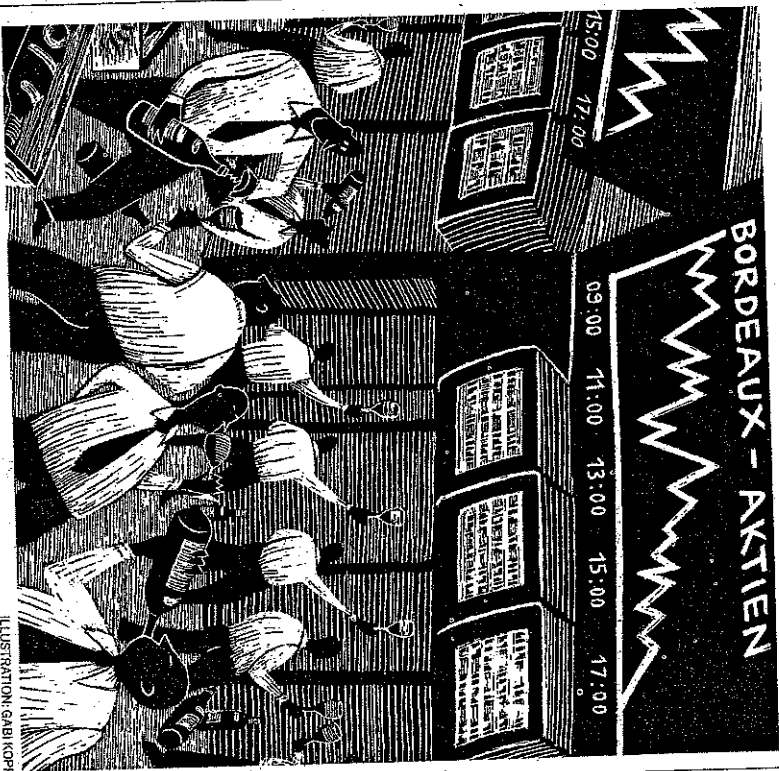
ILLUSTRATION: GABRI KOPP

Die für Weine ausgewiesenen Renditen müssen jedoch bei einer genaueren Betrachtung deutlich nach unten korrigiert werden. Während die Kauf- und Verkaufskosten für Finanzaktive weit unter einem Prozent liegen, betragen sie bei Weinauktionen etwa 15 Prozent für den