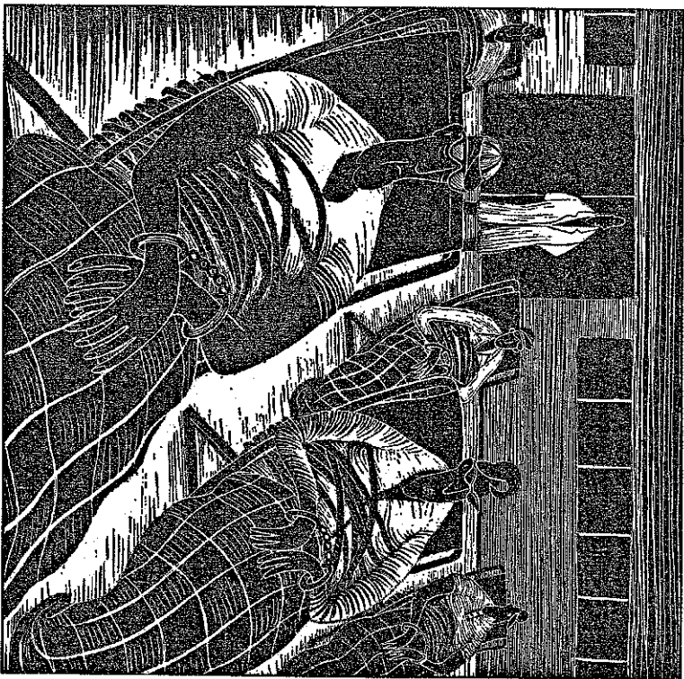
ILLUSTRATION GABRIEL KOPF

Die Debatte um die Altersversorgung hat sich in der Schweiz in letzter Zeit völlig einseitig am Zinssatz festgebissen, den die Versicherungsgesellschaften auf dem angesammelten Kapital entrichten müssen. Die Altersversorgung ist jedoch nicht allein eine Angelegenheit des Finanzmarktes. Entscheidend ist vielmehr die Real-